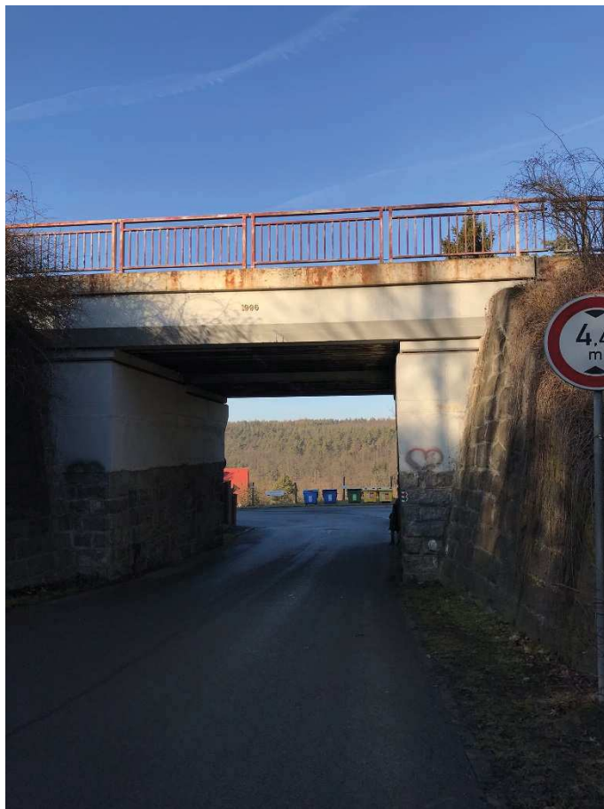
Most km 103,545 – staničení dráhy